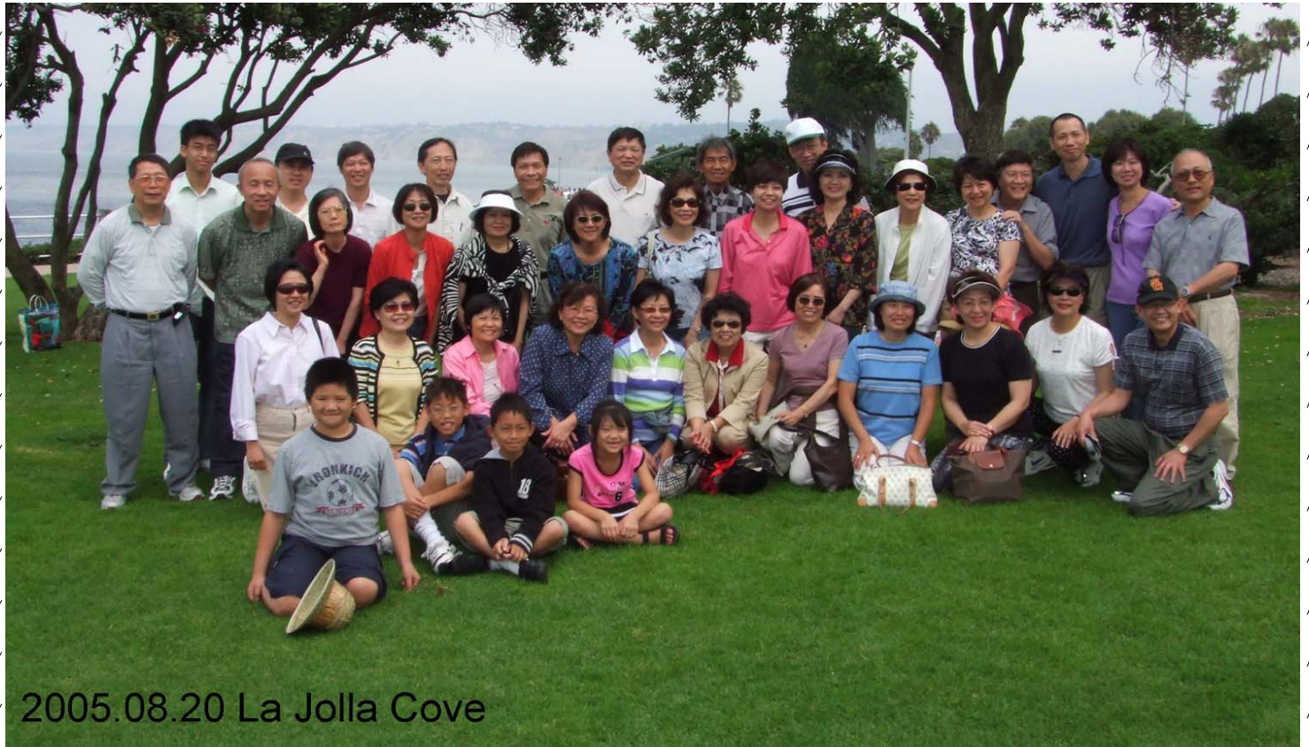
2005.08.20 La Jolla Cove

晚上在Cardiff by the Sea 的The Beach House享受晚餐。經過一天的相聚, 凡食物公用, 大夥兒歡聚在一起, 彼此有更多的溝通與認識, 相約以後還要再來一次。