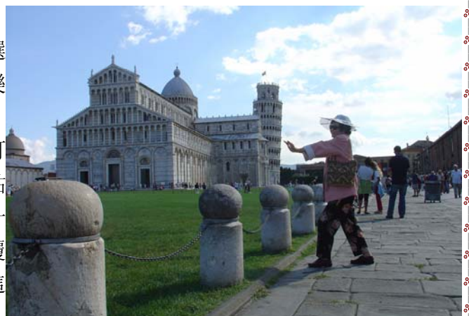
EUROPE ITALY PISA INCLINE TOWER