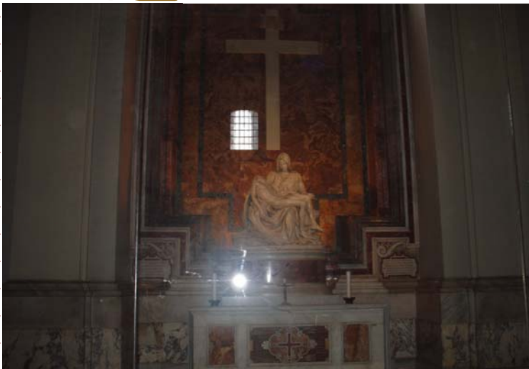
EUROPE ITALY VATICAN MICHELANGELO'S SCULPTURE